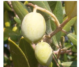
Photo 1 : Olive de variété Sabina devenant vert pâle à jaunâtre (code 80)

Evaluation des risques de piqûres de ponte et de dégâts dus au développement de la larve dans la pulpe : élevés d'autant que les conditions météorologiques sont optimales pour l'activité biologique et le développement de l'insecte.