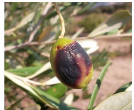
Photo 2 : Dégâts caractéristiques sur olive dus à l'asticot et trou de sortie de l'adulte