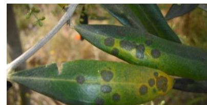
Photo 3 : Taches symptomatiques des contaminations dues au champignon F. oleagineum

Surveiller l'apparition des taches dues aux contaminations du printemps qui vont apparaître sur les feuilles âgées car les températures redeviennent favorables au développement de la maladie. En effet, les symptômes caractéristiques du champignon apparaissent avec des températures comprises entre 11 et 20°C. En deçà de 11°C et au-delà de 25°C le développement de la maladie est ralenti et la durée d'incubation s'allonge. Le temps nécessaire à l'apparition de la tache après la contamination varie donc avec la température.